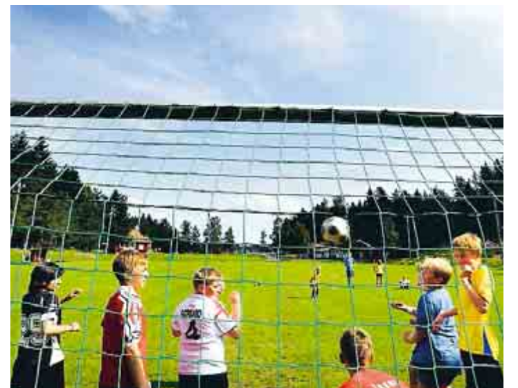
Gruppens favoritövning: Guld och silver. Om skytten gör mål åker närmaste försvarare ut. Om försvararen i stället räddar och tar bollen byter han eller hon plats med skytten. Skjuter skytten över åker han eller hon ut.

► Veckan bjöd även på disco på torsdagskvällen, seriematch mellan A-laget och Katrineholm på fredagen och Runtuna IK-dagen på lördagen med bland annat straffläggningstävling.