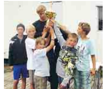
Lag Trosa Båtklubb Ungdom firar att det tagit tillbaka vandringspriset.